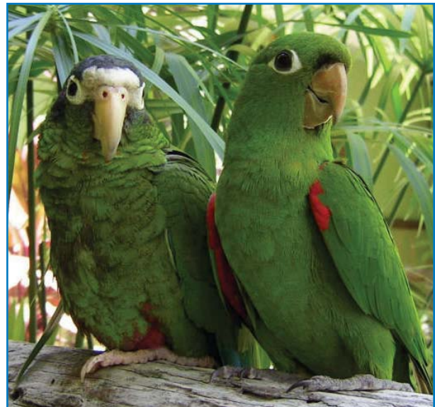
La cotorra ( Amazona ventralis ) y el perico ( Aratinga chloroptera ), ambos Vulnerables, son capturados para el tráfico ilegal de mascotas.

En República Dominicana se han registrado 23 especies amenazadas o Casi Amenazadas, que incluyen una especie En Peligro Crítico, cuatro En Peligro, nueve Vulnerables y nueve Casi Amenazadas. Sin embargo, tres de estas últimas no están representadas en las IBAs ya que nose considera que mantengan poblaciones significativas en el país: el gallito negro ( Laterallus jamaicensis ), el chorlito silbador ( Charadrius melodus ) y la cigüita ala de oro ( Vermivora chrysoptera ). El guaraguaíto ( Buteo ridwayi ), En Peligro Crítico, está actualmente confinado la IBA Los Haitises (DO018), donde su pequeña población está disminuyendo. El diablón ( Pterodroma hasitata ), En Peligro, mantiene una pequeña colonia de cría en la IBA Sierra de Bahoruco (DO006); esta IBA también mantiene poblaciones críticas de otras especies En Peligro como el pico cruzado ( Loxia megaplaga ), el zorzal de La Selle ( Turdus swalesi ) y el cúa ( Coccyzus rufigularis ). Muchas de las aves globalmente amenazadas están restringidas a los bosques latifoliados de altura y pinares. República Dominicana es también