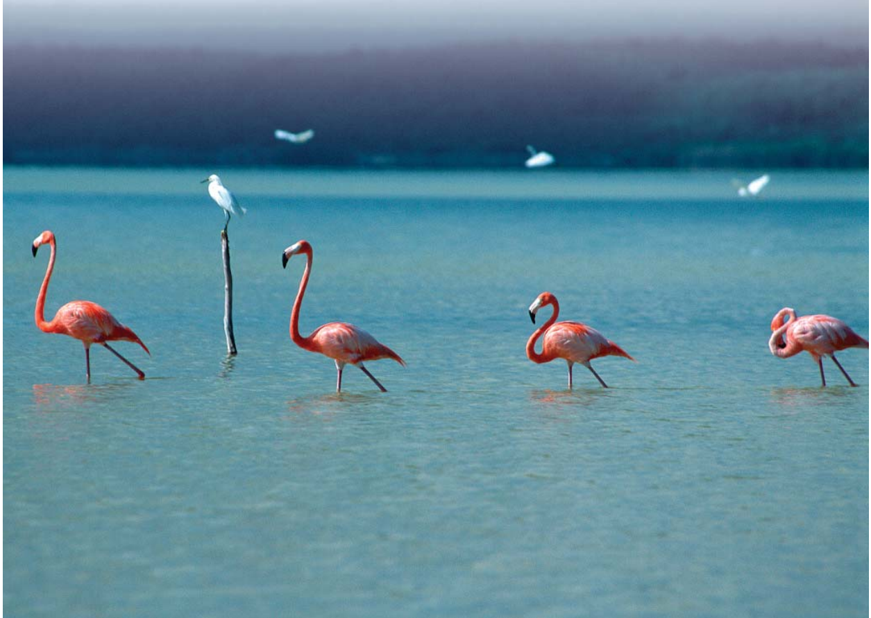
Flamencos en Laguna Oviedo (DO007).

país, hábitats y asociaciones vegetales están representados dentro de la red de IBAs. Algunas de las IBAs están reconocidas bajo otras designaciones internacionales, como el sitio Ramsar Lago Enriquillo, la Reserva de la Biosfera Jaragua - Bahoruco -Enriquillo, y los sitios de la red de Alianza para la Extinción Cero (AZE) Los Haitises y Sierra de Bahoruco.