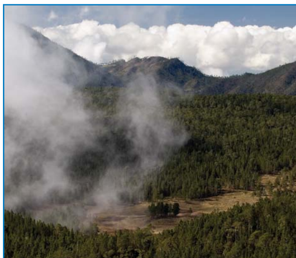
Valle Nuevo (DO011) es uno de los 11 sitios monitoreados para las amenazas (“Presión”), condición (“Estado”) y acciones de conservación (“Respuesta”) en las IBAs.

Se le ha dado continuidad a componentes clave del programa de IBAs, mediante la coordinación de actividades como el monitoreo, celebración de fechas clave en el calendario ambiental como el Festival Mundial de las Aves), la conservación de especies amenazadas, fortalecimiento de las redes de Grupos Locales de Conservación y la mejora de los medios de vida locales. Estas actividades han ayudado a crear conciencia sobre el concepto de las IBAs y a mantener el entusiasmo e interés entre