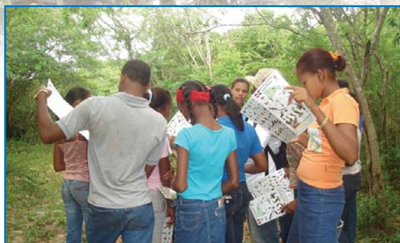
Grupo Local de Conservación en Fondo Paradí.

La IBA Parque Nacional Jaragua (DO007) se encuentra en el suroccidente de República Dominicana, en la península de Barahona. La IBA es de importancia global para especies amenazadas, distribución restringida y congregatorias, así como otras especies endémicas y amenazadas de flora y fauna, como el cacheo de Oviedo ( Pseudophoenix ekmanii ), En Peligro Crítico, y la iguana de Ricord ( Cyclura ricordii ). El Grupo Jaragua (afiliado de BirdLife en República Dominicana) realizó dos proyectos para involucrar a las comunidades en iniciativas de uso sostenible en la Laguna de Oviedo (una laguna costera salada de 27 km 2 dentro del parque) y en Fondo Paradí, en la zona de amortiguación. Los proyectos buscaron contribuir con la conservación a largo plazo de los hábitats de aves y su utilización sostenible. En la Laguna de Oviedo, el Ministerio de Medio Ambiente y la Agencia Española de Cooperación al Desarrollo realizaron obras de infraestructura en el marco del proyecto, como señalización, un centro para visitantes y una torre de observación para apoyar actividades sostenibles para aproximadamente 2000 turistas al año. El fortalecimiento de las capacidades de los de la capacidad para guías locales continúa, con el fin de mejorar la calidad de los servicios de ecoturismo en la Laguna de Oviedo. En Fondo Paradí, la comunidad local y los miembros del Grupo Local de