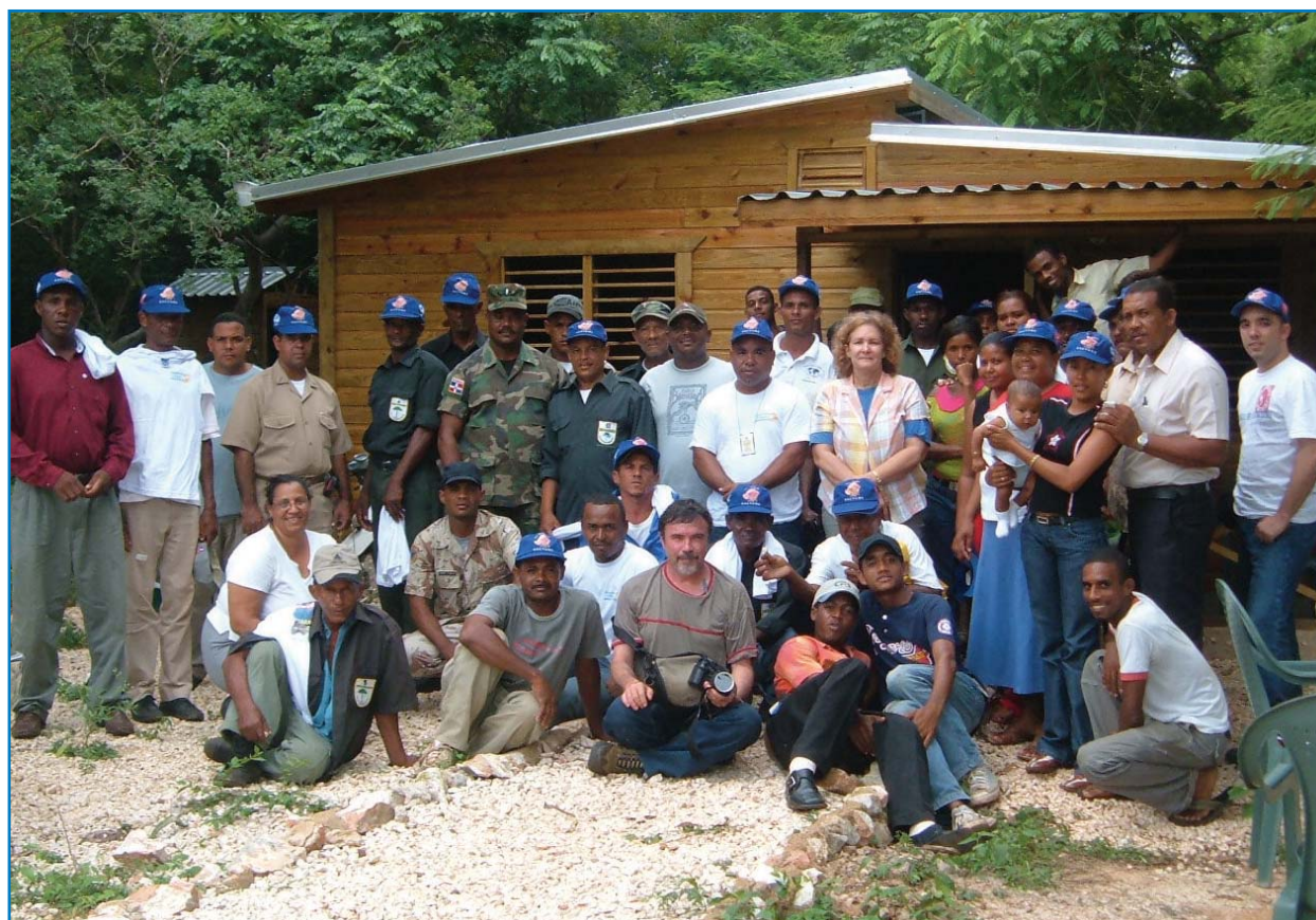
Voluntarios Comunitarios de Jaragua y otros actores locales han jugado un papel fundamental en el monitoreo de la IBA y actividades educativas en la Laguna Oviedo, dentro del Parque Nacional Jaragua (DO007).

Si desea más información sobre las especies confirmadas para cada sitio, visite los perfiles individuales de las IBAs en Data Zone: www.birdlife.org/datazone/sites