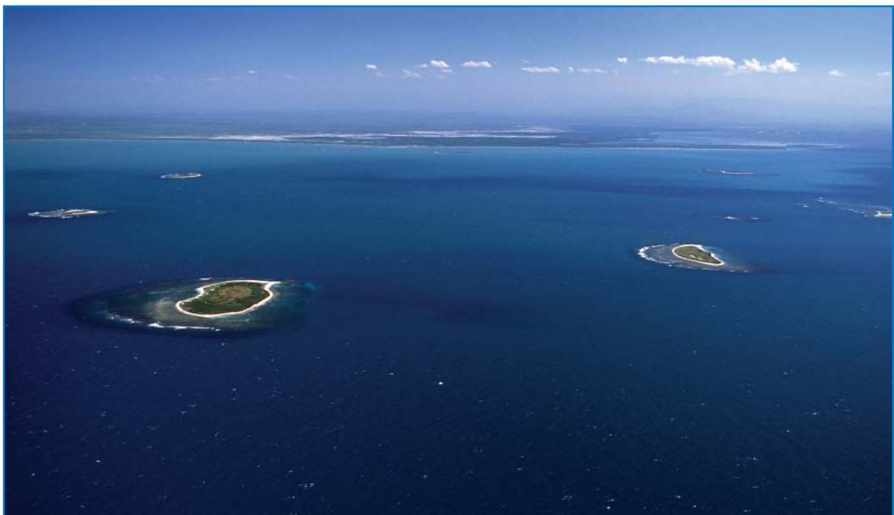
Los Cayos Siete Hermanos mantienen números globamente significativos de aves marinas reproductivas.

importante para grandes poblaciones de aves acuáticas y marinas reproductoras e invernantes. Laguna Limón (DO019) y Laguna Cabral (DO008), con 6000 y 3000 individuos respectivamente, mantienen las mayores poblaciones reportadas de la gallareta caribeña ( Fulica caribaea ), una especie Casi Amenazada. Laguna Cabral también es el hogar de algunas de las mayores concentraciones invernales de patos en el Caribe, con hasta 160.000 individuos observados (de varias especies). Las aves marinas se concentran principalmente en las islas alrededor de la costa de República Dominicana. Las colonias son relativamente poco conocidas en términos de estado y tamaño, pero la colonia del charrán oscuro ( Sterna fuscata , con 80.000 parejas) en la Isla Alto Velo es una de las mayores en el Caribe. El seguimiento de otras islas conocidas de cría proporcionaría información valiosa que daría lugar a la identificación de nuevas IBAs.