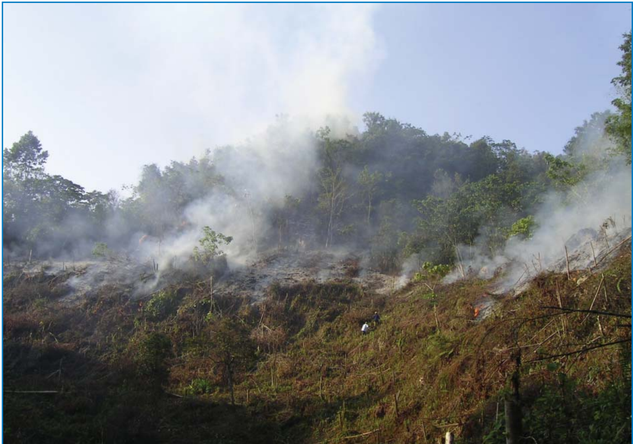
La agricultura de tala y quema en la IBA de Los Haitises (DO018) amenaza la integridad de este ecosistema crítico.